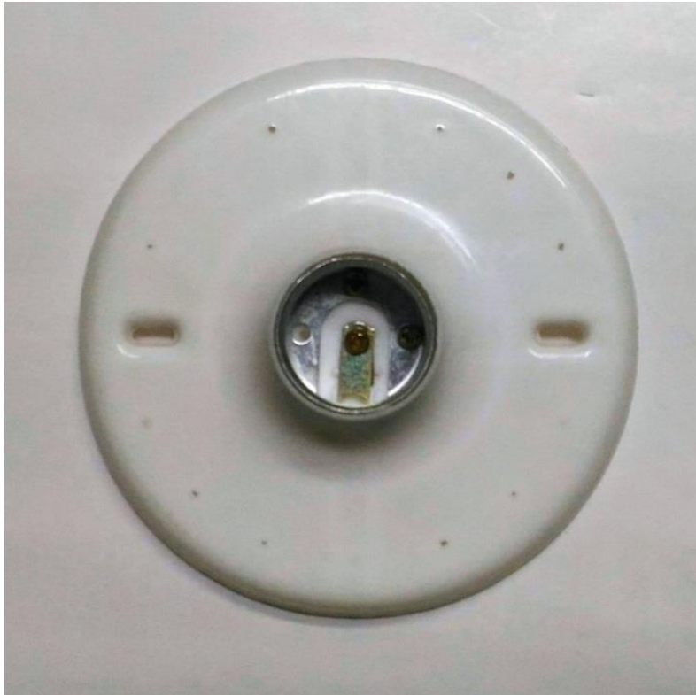
圖 1、具有單一螺旋型燈座(無燈罩)及支撐、固定光源所需零件之燈具商品(市售俗稱為燈座)，為應施檢驗商品